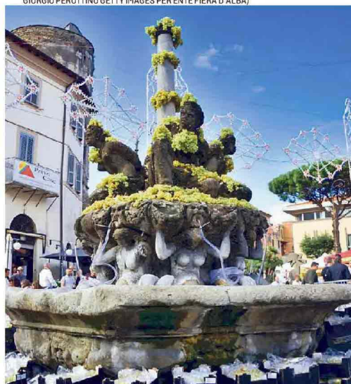
1. La magia del tartufo bianco è più forte della mascherina; 2. Un piatto di tajarin ai funghi; 3. Il formaggio Bitto è un'altra star d'autunno 4. La sagra dell'Uva a Marino; 5. La festa del Torrone a Cremona