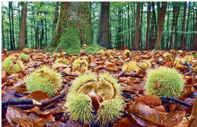
Autunno, stagione delle castagne che colorano i boschi

Dal 9 ottobre al 5 dicembre, la 91esima edizione della Fiera internazionale del tartufo bianco di Alba si conferma una delle principali vetrine dell'alta gastronomia e delle eccellenze italiane. Tutti i weekend sono previsti cooking show con grandi chef, analisi sensoriali del tartufo e wine tasting experience oltre al Mercato mondiale del tartufo. La ma-