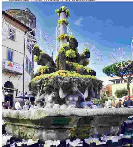
1. La magia del tartufo bianco è più forte della mascherina; 2. Un piatto di tajarin ai funghi; 3. Il formaggio Bitto è un'altra star d'autunno 4. La sagra dell'Uva a Marino; 5. La festa del Torrone a Cremona