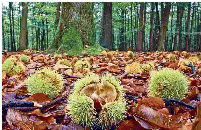
Autunno, stagione delle castagne che colorano i boschi

Fino al 5 dicembre va in scena l'oro bianco di Alba Ad Albareto tocca ai porcini Caldarroste a Frabosa Sottana