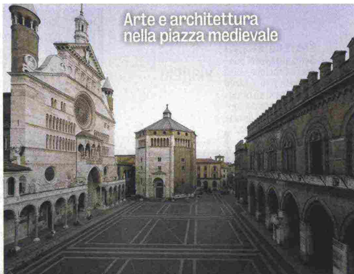
Arte e architettura nella piazza medievale

Cremona dal 17 al 25 novembre diventa capitale della gola, con la Festa del Torrone, con eventi e appuntamenti ad animare la città. Come la rievocazione del matrimonio tra Francesco Sforza e Bianca Maria Visconti , domenica 18, nella cornice di Piazza del Comune, preceduta dalla sfilata nel centro storico, con sbandieratori, musicisti, dame e cavalieri. Alla festa più dolce d'Italia, imperdibili le degustazioni di torrone alla scoperta di nuovi modi di gustare il dolce cremonese. Quest'anno nei due weekend di festa torna il "Torrone Live", nella Loggia dei Militi: all'evento si assiste in piazza alla produzione del torrone con distribuzione al pubblico del dolce appena fatto. Tema della festa "Il Novecento e ►►