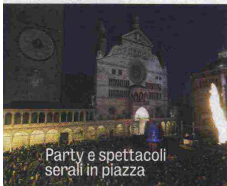
Party e spettacoli serali in piazza