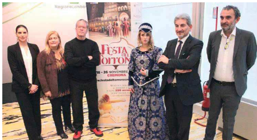
Cappellini, Manfredini, Knam, Cattaneo e Pellicciardi ieri mattina alla presentazione della Festa del Torrone a Milano