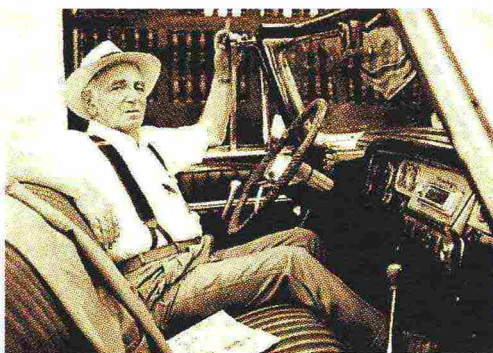
Charles Aznavour in un'immagine dall'album Colore ma vie