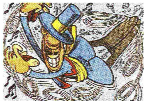
Un disegno di Benito Jacovitti

1959 → Nelle sale americane esce il kolossal Ben-Hur , diretto da William Wyler