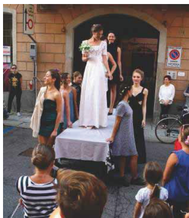
Spettacoli e animazione in via XX Settembre