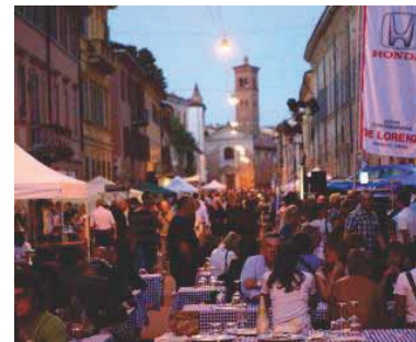
La festa di via XX Settembre dello scorso anno